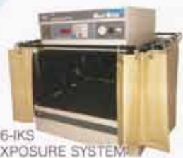
26-IKS EXPOSURE SYSTEM

データからすぐ版が作れちゃう! フィルム不要なので出力代がかからない! それだけじゃなくて、今まで再現できなかったアミがきれいに表現できるから印刷もより鮮明に美しく仕上がります!