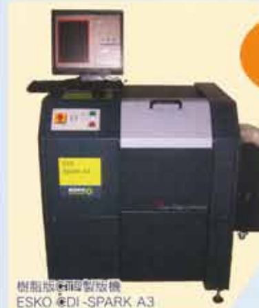
樹脂版・PS版製版機 ESKO eDI-SPARK A3

シール製版に必要な製版機も社内に完備。 抜き型設備同様、緊急のご注文にも威力を発揮します。