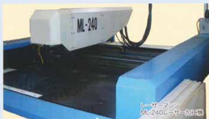
レーザーマシン ML-240レーザー加工機

自社で刃型を製造できるので、緊急性を要する「訂正シール」などの即時対応には特にその威力を発揮します。専門の抜き型業者に依頼すると、その分納期も予算もかかってしまいます。