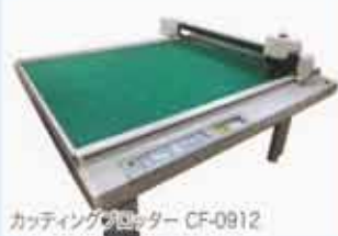
カッティングプロッター CF-0912